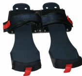
285-C C2 Flexfoot Platte