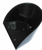
283 Fersenkappe für Clogstemmbrett