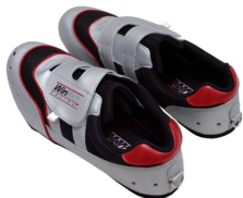
240 Ruderschuh silber